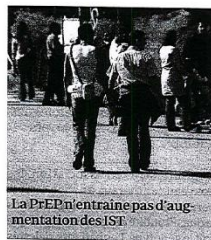
La PrEP n'entraîne pas d'augmentation des IST

Les derniers résultats de PROUD, essai de prophylaxie pré-exposition en continu, publiés dans « The Lancet » démontrent de nouveau l'efficacité de cette stratégie en prévention de l'infection à VIH dans la communauté gay. Les discussions quant à sa mise en place en France se prolongent au grand dam du Pr Jean-Michel Molina, principal investigateur de l'essai Ipergay en France (PrEP à la demande), qu'il est déraisonnable d'attendre tant sur le plan scientifique que du point de vue de la santé publique.